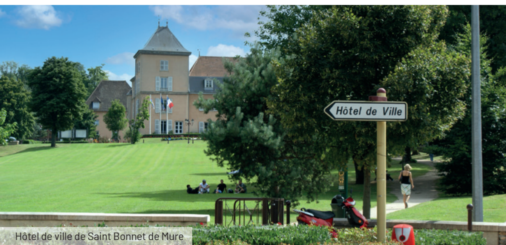
Hôtel de ville de Saint Bonnet de Mure

Richement dotée en commerces et services de proximité, Saint-Bonnet-de-Mure possède également de nombreux équipements publics qui participent au bien-vivre des Murois : deux groupes scolaires, un pôle d'accueil petite enfance, un vaste complexe sportif, une zone de loisirs et plusieurs espaces verts de qualité.